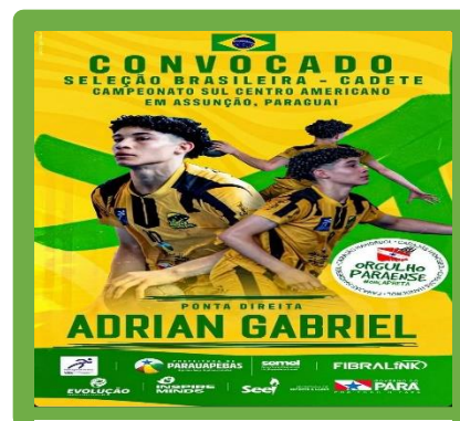
Figura 26 - Convocação para Seleção Brasileira