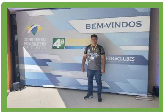
Figura 24- Congresso Brasileiro de Clubes