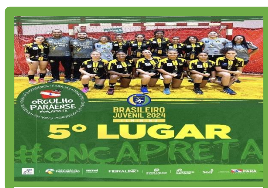
Figura 14 - 5º Lugar Campeonato Brasileiro Juvenil Feminino