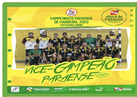
Figura 2 - Vice-Campeão Paraense Mirim Masculino