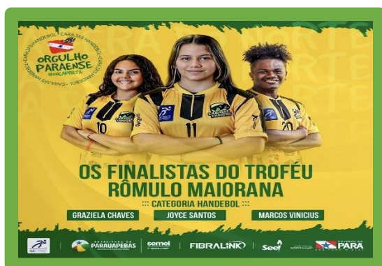
Figura 27 - Troféu Rômulo Maiorana