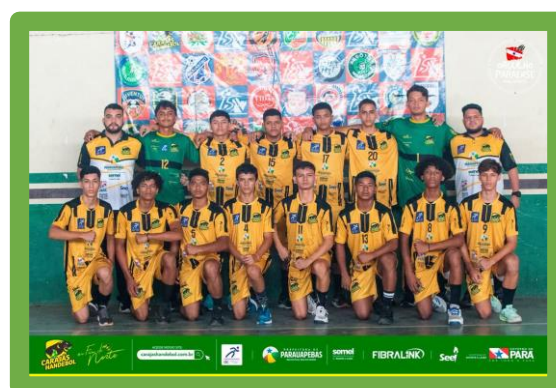
Figura 4 - 5º Lugar Campeonato Paraense Juvenil Masculino