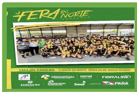
Figura 19 - Copa LDB