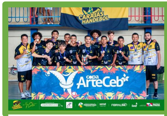
Figura 16 - Copa ArteCeb