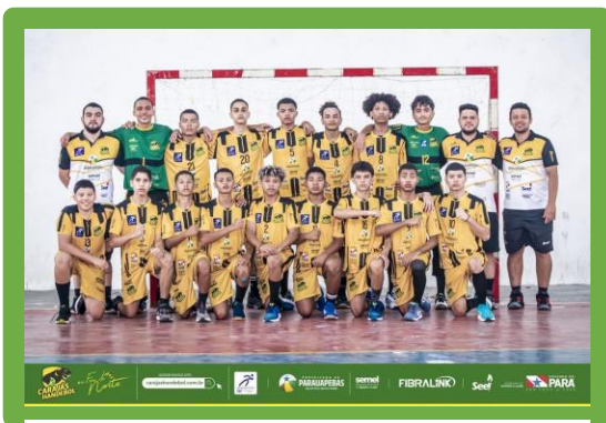
Figura 3 - Copa Cametá

ASSOCIAÇÃO DE DESPORTOS CARAJÁS - A D CARAJÁS