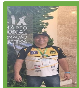
Figura 23 - X Seminário Nacional de Formação Esportiva