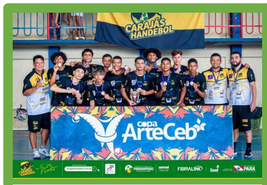
Figura 17-Copa ArteCeb