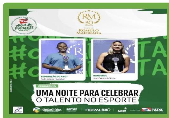
Figura 28 - Troféu Rômulo Maiorana