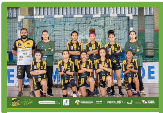
Figura 7 - 5º Lugar Campeonato Brasileiro Mirim Feminino