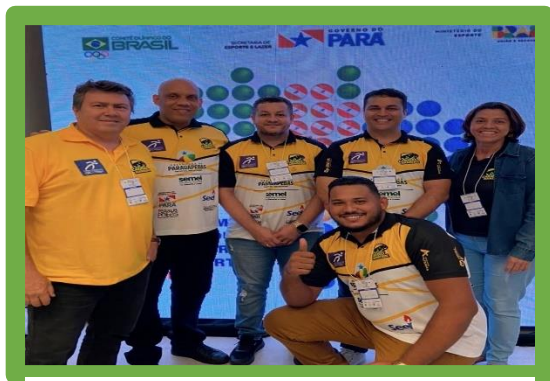
Figura 22 - Fórum Estadual de Formação Esportiva

ASSOCIAÇÃO DE DESPORTOS CARAJÁS - A D CARAJÁS