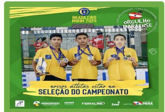
Figura 6 - Seleção do Campeonato - Melhor Pivô, Melhor Goleiro e Melhor Defensor