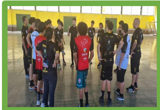
Figura 21 - Camping do Carajás Handebol