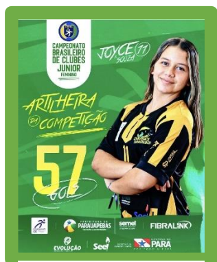
Figura 11 - Artilheira da Competição

ASSOCIAÇÃO DE DESPORTOS CARAJÁS - A D CARAJÁS