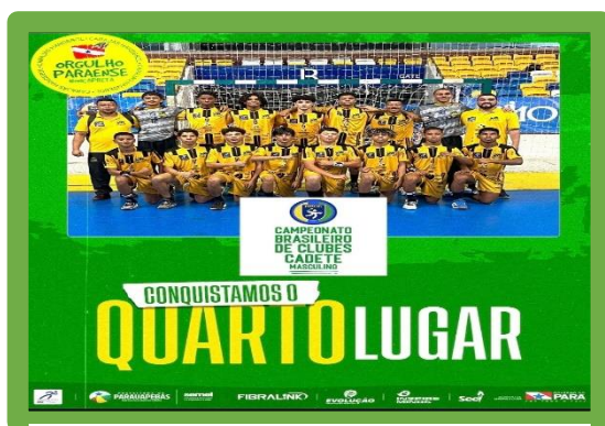
Figura 13- 4º Lugar Campeonato Brasileiro Cadete Masculino