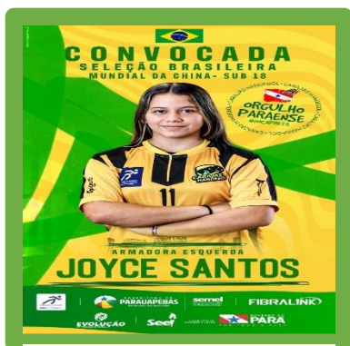
Figura 25 – Convocação para Seleção Brasileira

ASSOCIAÇÃO DE DESPORTOS CARAJÁS - A D CARAJÁS