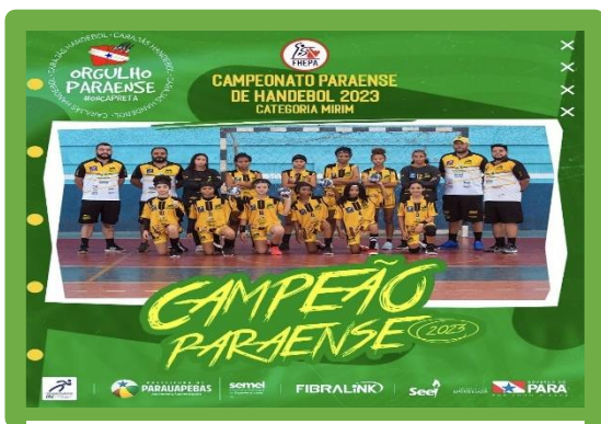
Figura 1 - Campeão Paraense Mirim Feminino

ASSOCIAÇÃO DE DESPORTOS CARAJÁS - A D CARAJÁS