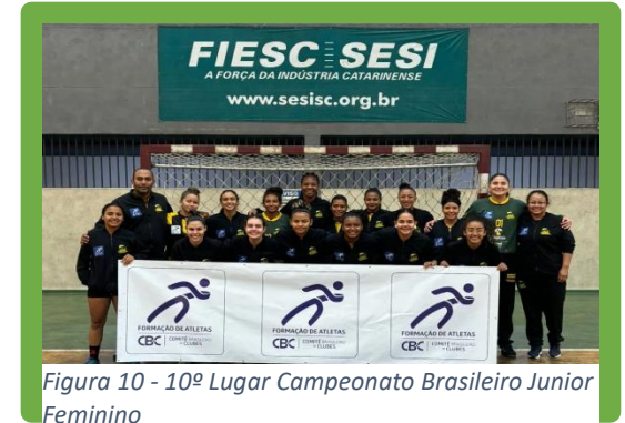
Figura 10 - 10º Lugar Campeonato Brasileiro Junior Feminino

RUA B, 400 – APTO 06 – CIDADE NOVA – CEP 68515-000 – PARAUAPEBAS – PA