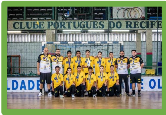
Figura 5 - 3º Lugar Campeonato Brasileiro Mirim Masculino

Em dezembro competimos no Campeonato Brasileiro Juvenil Feminino, realizado no município de Novo Hamburgo-RS, terminamos em 5º Lugar