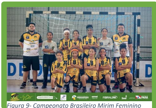
Figura 9 - Campeonato Brasileiro Mirim Feminino