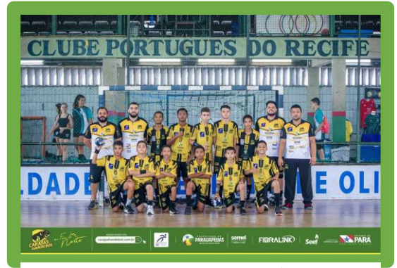
Figura 8 - 9º Lugar Campeonato Brasileiro Mirim Masculino