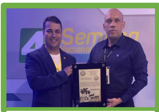
Figura 4 - Troféu Top 100 Clubes - Bronze

RUA B, 400 – APTO 06 – CIDADE NOVA – CEP 68515-000 – PARAUAPEBAS – PA