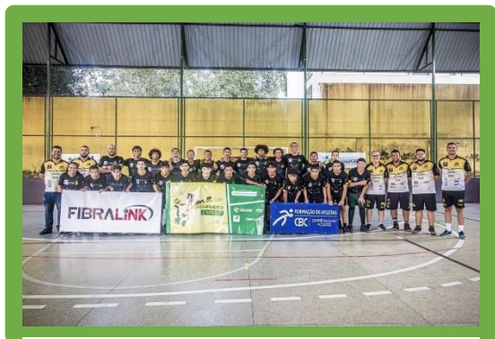
Figura 20 - 3º Acampamento de Handebol do Carajás Handebol

Realizamos a formação da comissão técnica, no município de Marabá-Pa.