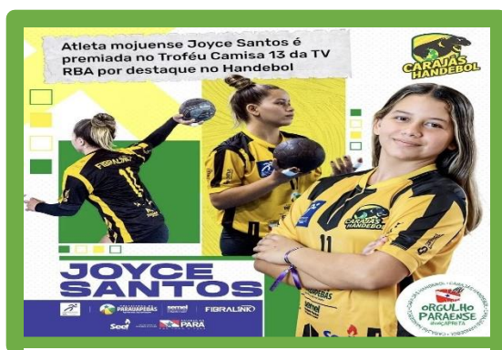
Figura 29 - Troféu Camisa da TV RBA