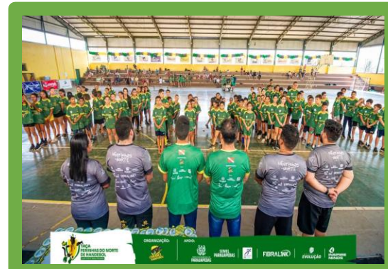
Figura 18 - Taça Ferinhas do Norte